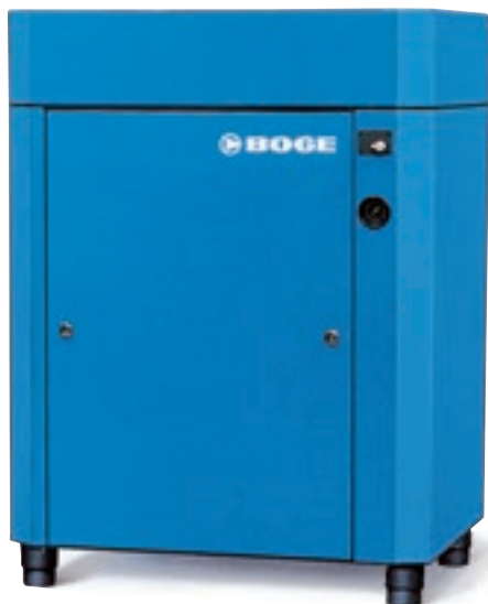
BSOL 480 BSOL 480 DM