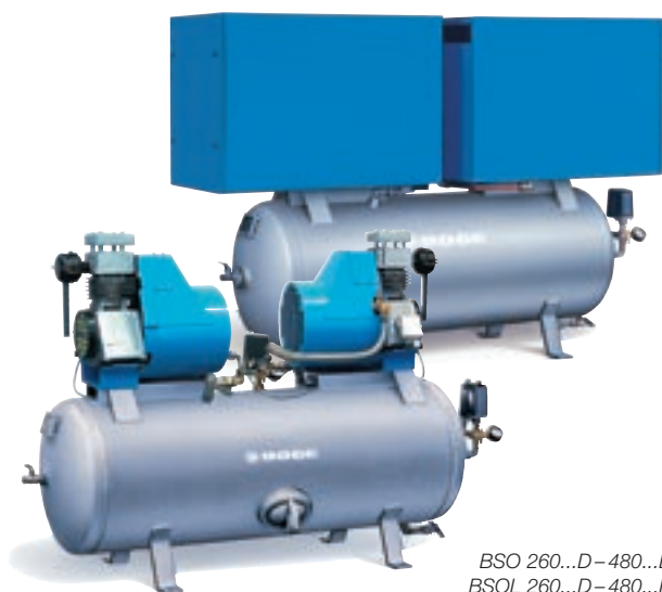
BSO 260...D–480...D BSOL 260...D–480...D