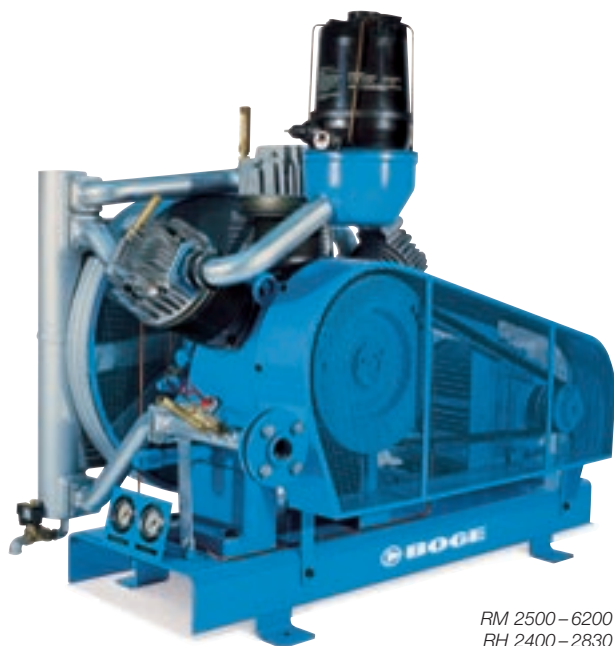
RM 2500 – 6200 RH 2400 – 2830

Производительность: 1800 – 4840 л/мин Макс. давление: 10 – 30 бар Мощность двигателя 15 – 37 кВт 100% промышленное исполнение Модели в стандартном исполнении и с усиленной звукоизоляцией