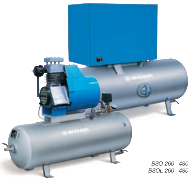
BSO 260–480 BSOL 260–480