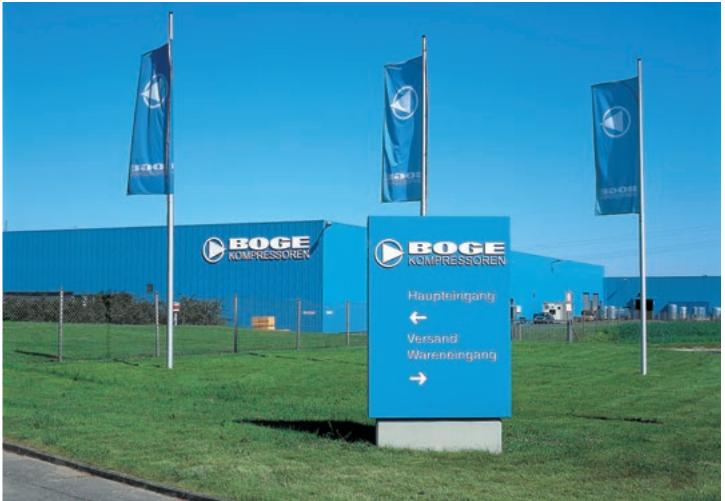
Завод BOGE KOMPRESSOREN в г. Бельфельд . Современные производственные мощности гарантируют самое высокое качество продукции