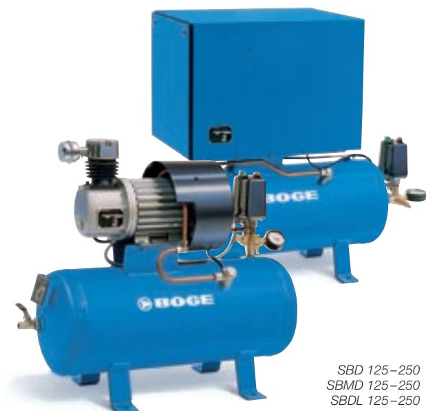
SBD 125–250 SBMD 125–250 SBDL 125–250