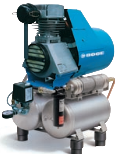
BSO 480 DM