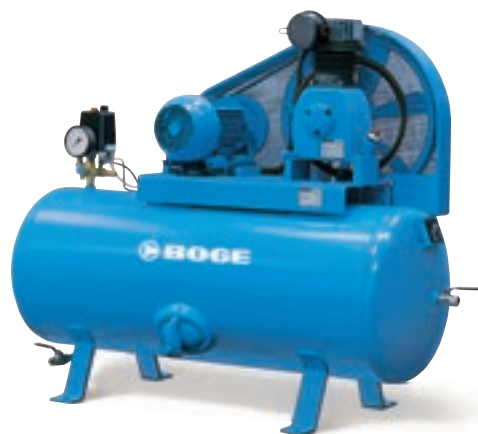
SB 270–475 SB 710–2600 SBM 320–2030

Производительность: 185 – 1913 л/мин Макс. давление: 10 и 15 бар Мощность двигателя: 1.5 – 15 кВт 100% промышленное исполнение