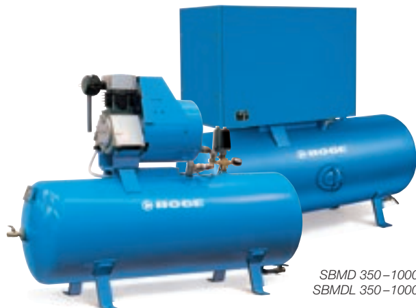
SBD 350-1000 SBDL 350-1000