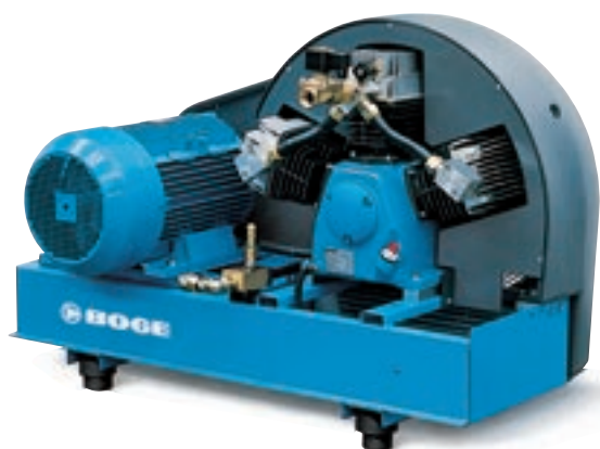
SRMV 390–720 SRHV 200–470