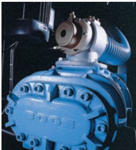
Качество: Сделано в Германии