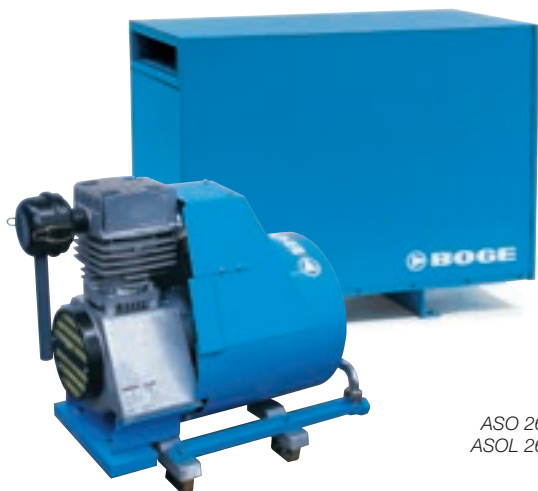
ASO 260–480 ASOL 260–480

Производительность: 156 – 367 л/мин; Макс. давление: 8 – 10 бар Мощность двигателя: 1.5 – 3.2 кВт 100% промышленное исполнение Модели в стандартном исполнении и с усиленной звукоизоляцией