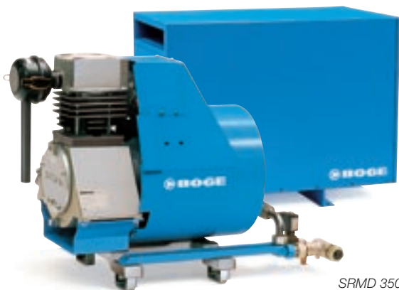
SRD 350-1000 SRDL 350-1000