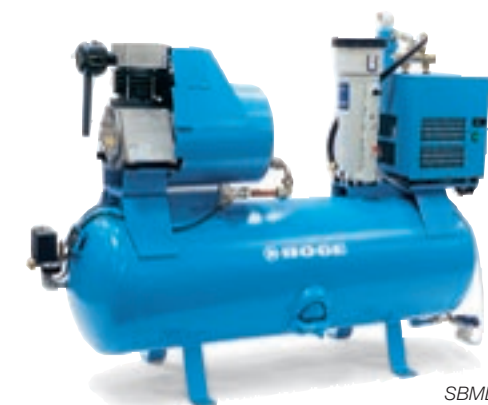
SBD 350 DB-1000 DB SBDL 350 DB-1000 DB