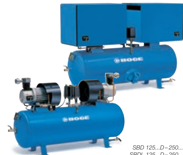
SBD 125...D–250...D SBDL 125...D–250...D